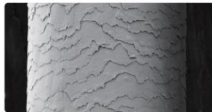
ライトニングシステム